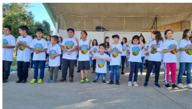
Movimentos de Rua - Palco Jesus Marodin