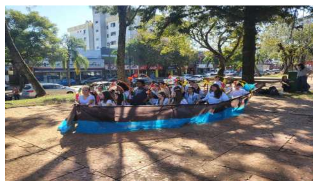
Movimentos de rua - Praça Olmiro Ferreira Porto