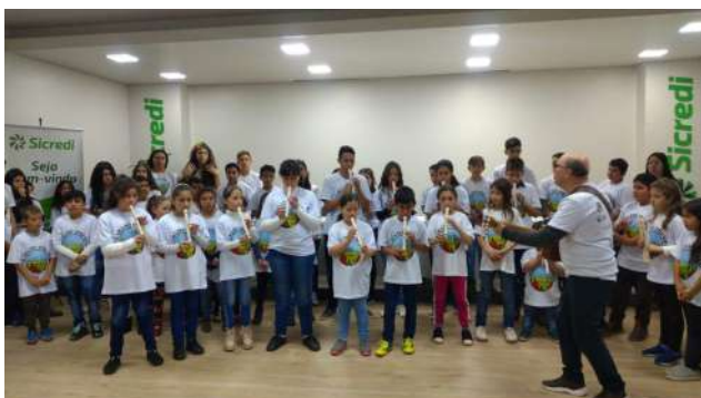
Manifestações artísticas em instituições financeiras