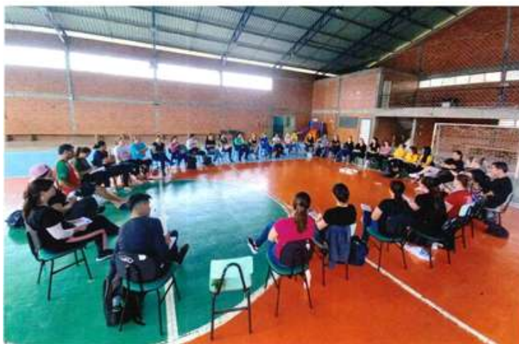
Figura 4: PROFORMA (Programa de Formação Continuada de Soledade / RS) - (2022)