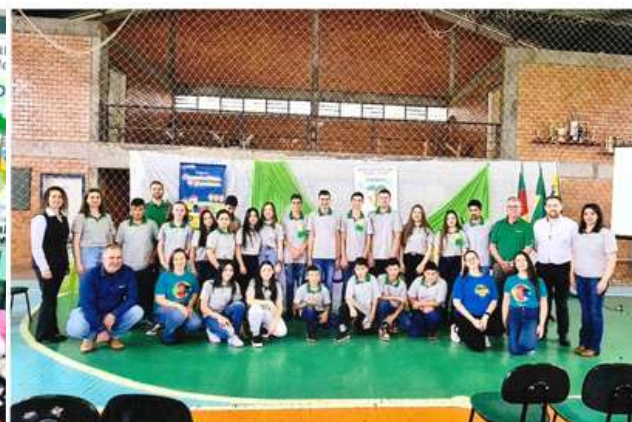
Figura 8: Assembleia da COOPEAG (2022)