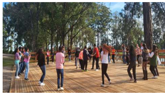
Aulas em espaços públicos - Parque de Eventos Rui Ortiz