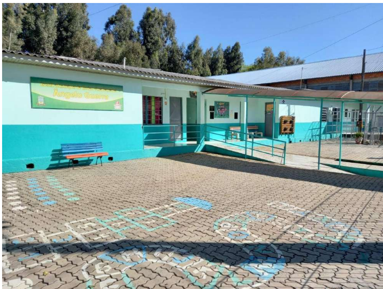
Figura 1: EMEF Ângelo Guerra (2023)