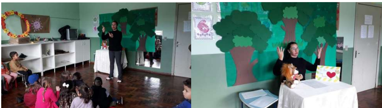
História: O Leão que não sabia escrever. Autor: Martin Baltscheit

Assim, com a Contação de Histórias na língua falada e de sinais, as atividades pedagógicas tornam-se possíveis e inclusivas 2 .