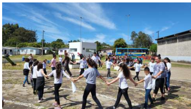
Movimentos de rua nos bairros da cidade