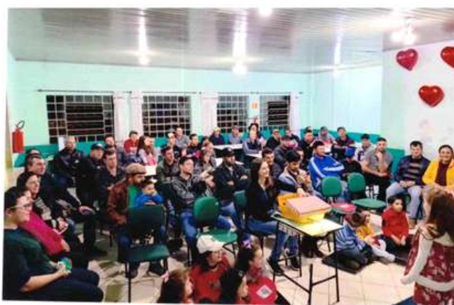
Figura 5: Reuniões e homenagens com expressiva participação das famílias (2022)