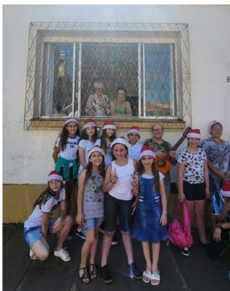
Movimento de rua - Cânticos Natalinos na janela

O Seara do Aprendiz tem a intenção de potencializar as atividades pedagógicas e culturais, envolvendo as crianças e jovens das diversas comunidades de Soledade oportunizando a estas diferentes vivências da cultura e identidade local, trabalhando com os usos e costumes, os saberes e fazeres da ciência da arte, da literatura, da história de Soledade e do Rio Grande do Sul.