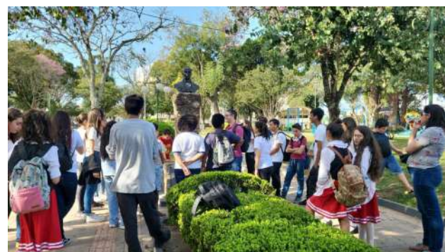
Aula em espaços públicos sobre história e identidade 4

educação e as manifestações forma de ressignificar as educando como parte principal educando tem a oportunidade dimensões da arte e da criatividade passa a ser percebida, por ele,