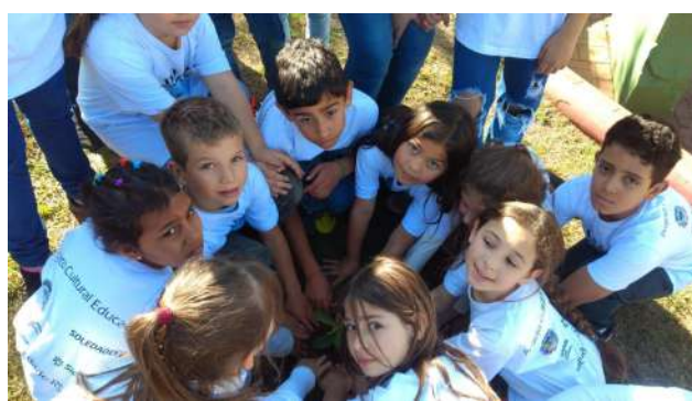
Plantio de Erva Mate, árvore símbolo do RS, no Monumento ao Gaúcho - Praça Olmiro Ferreira Porto