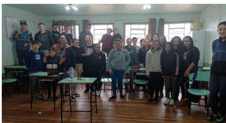
Figura 3: Final da palestra com todos os alunos