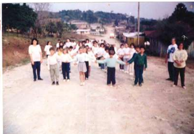
Figura 6: Desfile na comunidade (7 de setembro de 1994)