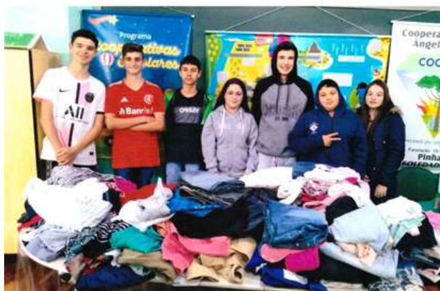
Figura 7: Campanha do agasalho realizada pela nossa Cooperativa escolar (COOPEAG)